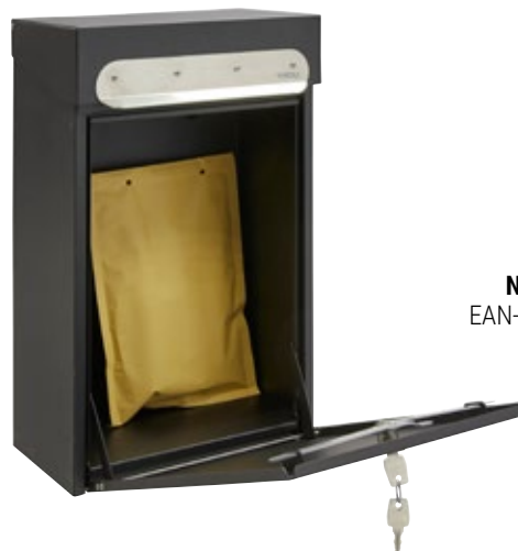
NERO EP1004 EAN-8425181738382