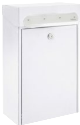
BIANCO EP1001 EAN-8425181738375