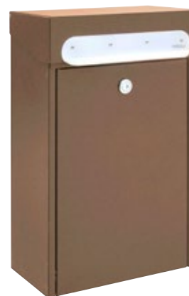
OSSIDO EP1008 EAN-8425181738399